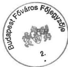
dr. Számadó Tamás

A főpolgármester – a katasztrófavédelemről és a hozzá kapcsolódó egyes törvények módosításáról szóló 2011. évi CXXVIII. törvény 48. § (4) bekezdése alapján gyakorolt –hatáskörében eljárva: