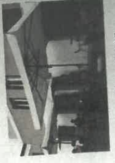
Fotó a terasz emelkedő emelkedéséről és arányairól - a panyva színe egyeztetendő