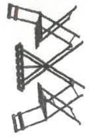
a teraszról használt asztalok és székek felvétel